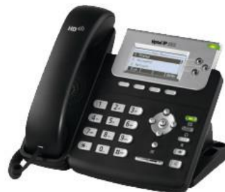
Tiptel IP 282