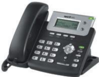
Tiptel IP 280