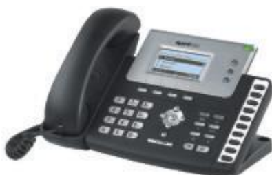
Tiptel IP 284